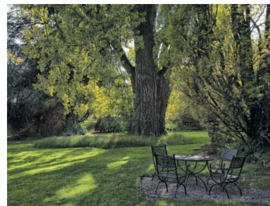
Mal aufgeräumt, mal üppig bepflanzt, als gelte es, einen Dschungel anzulegen: Schloss Arenenberg (oben), Hermann-Hesse-Haus mit Garten in Gaienhofen (großes Bild) und Stiegeler Park (kleine Bilder).