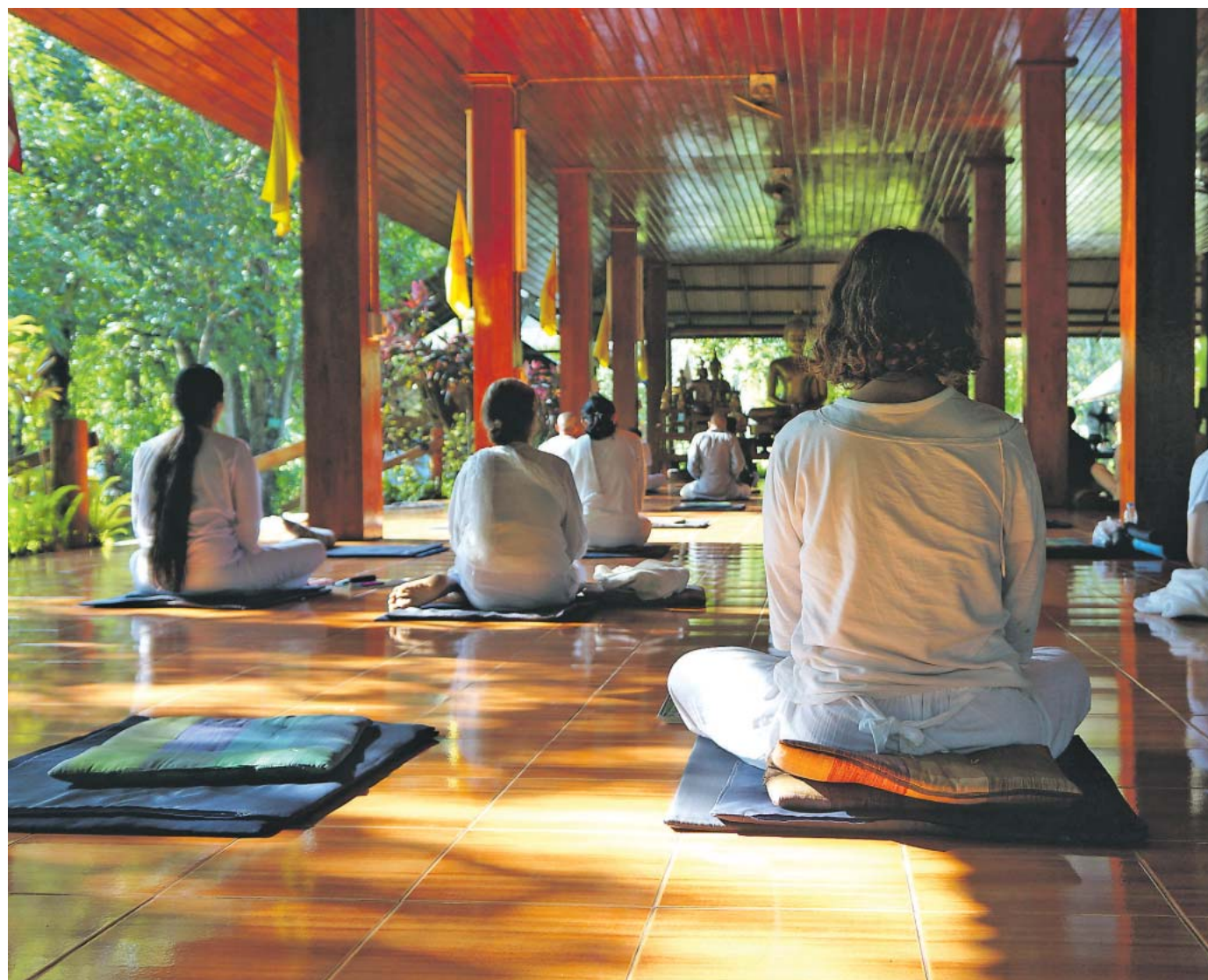
Jetzt bloß nicht ablenken lassen: Meditation gehört zum Tempelalltag, aber auch Kartoffelschälen und Putzen.

Über dem Schulterchluss zweier Berge blitzt der Morgenstern herüber, als ich mich am nächsten Tag auf den Weg zur Dhamma Hall mache. Dort händigt